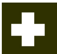
Fig.2: « Premier secours »